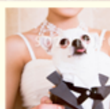
ワンダフルプラン